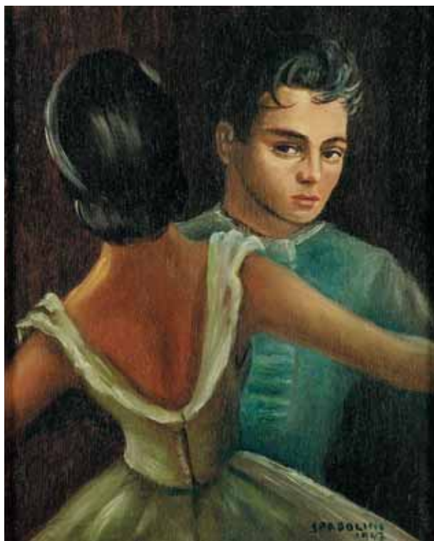
Sopra: “Duilio, la première leçon de danse”, Spadolini 1947, olio su tela cm. 28 x 35 (Coll. P. Oger)